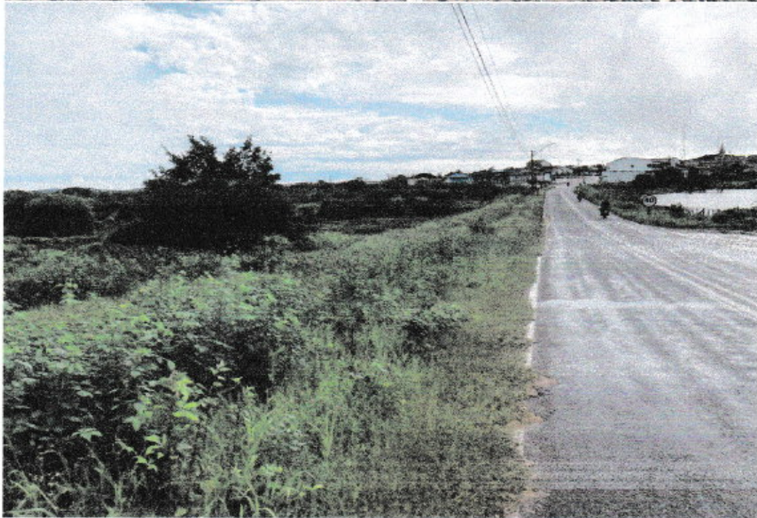
Potiretama Abril de 2024

COM. DE POTIRETAMA 107 + RUBRICA COM. DE POTIRETAMA