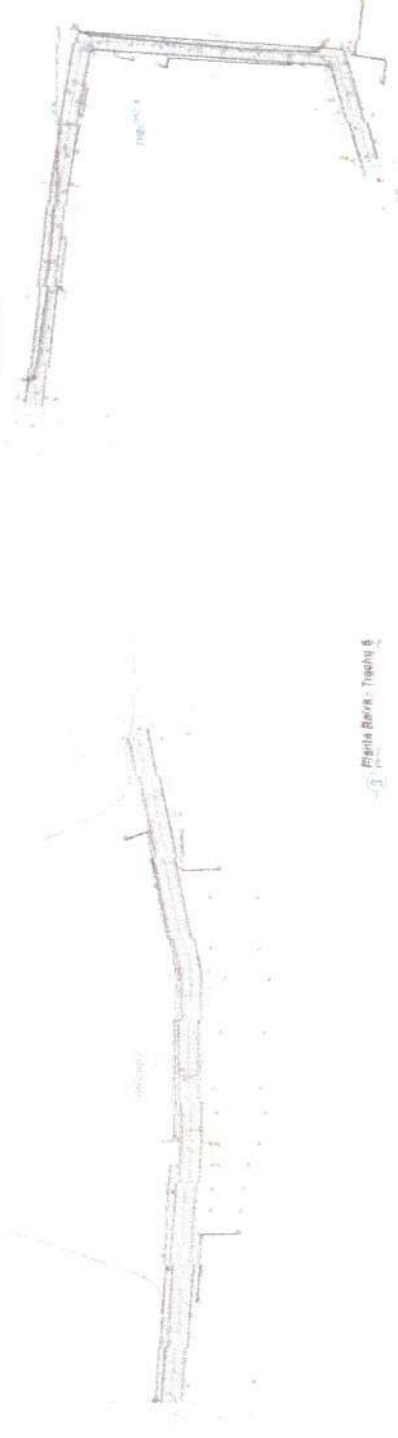
6. Planta Base - Trecho 6